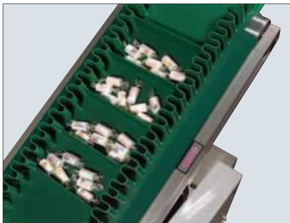
サイドウォール使用例2