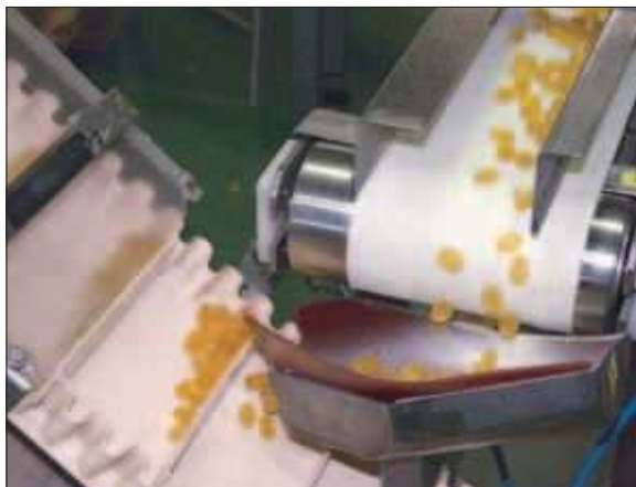
サイドウォール使用例1